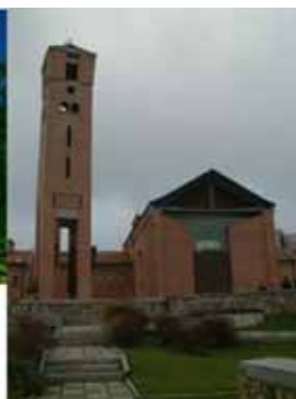
Miskolc, római katolikus templomegyüttes, Ferencz István