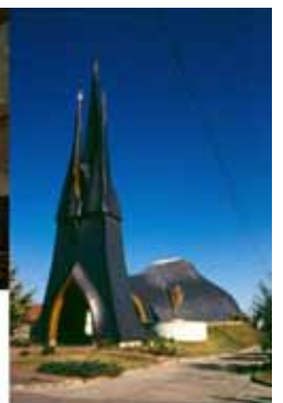
Paks, római katolikus templom, Makovetz Imre

Forrás: Vukoszavlyev Zorán PhD - Templomépitészet Magyarországon az ezredfordulón